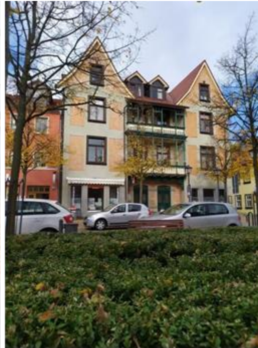
Льменау, центр міста