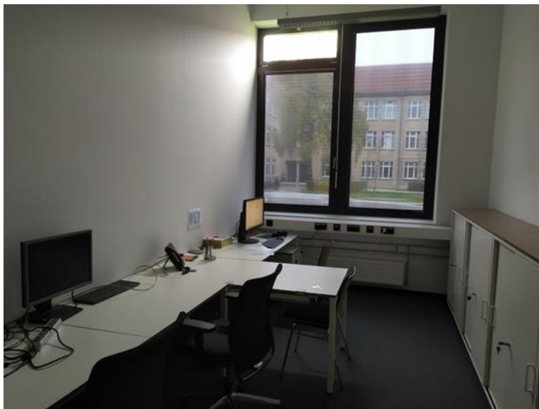
Мій офіс, кімната 1065

Це нова будівля факультету обчислювальної техніки та автоматики імені піонера сучасних обчислювальних технологій Конрада Цузе (1910 - 1995). Після того, як я приїхав до Ільменау, мій керівник, пан Йоханнес Нау, показав мені будівлю та офіс, в якому я мав працювати.