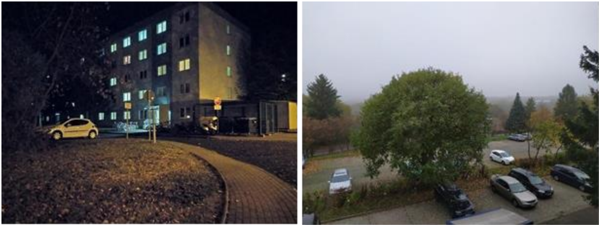
Мій гуртожиток (Haus Q) у ночі та вид з вікна моєї кімнати.

Кожен з нас мав окрему добре обставлену кімнату та загальну кухню. Умови були непогані, і система опалення працювала добре в холодні зимові місяці. Єдине, чого не вистачало – це пральні у будинку.