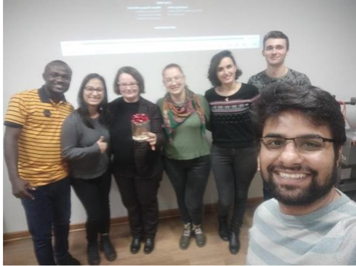
Новорічна вечірка у класі німецької мови