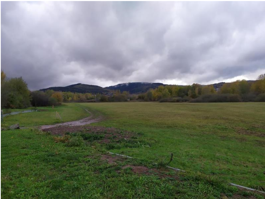
Ільменау, за містом