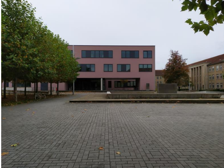
Головний вхід до Zusebau

Це нова будівля факультету обчислювальної техніки та автоматики імені піонера сучасних обчислювальних технологій Конрада Цузе (1910 - 1995). Після того, як я приїхав до Ільменау, мій керівник, пан Йоханнес Нау, показав мені будівлю та офіс, в якому я мав працювати.