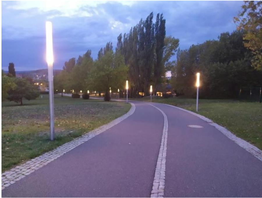
Пішохідна та велосипедна дорога у Кампусі

Місто чисте та організоване, з прекрасним центром, кафе, ринками, банками та невеликими готелями та поштовим відділенням. У центрі міста є велика скляна будівля під назвою Eishalle для катання на ковзанах.